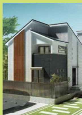
※今回見学頂ける会場の外観イメージです。