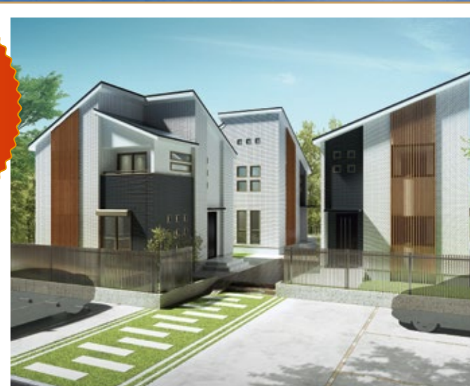
※掲載の画像はイメージです。一部仕様が異なる場合があります。 ※1:賃料は、横浜市営地下鉄ブルーライン「センター北駅」徒歩10分に上記プランを建てた場合(平成29年8月時点)の想定です。(その賃料が確実に得られることを保証するものではありません)。又、公租公課その他当該物件を維持するために必要な費用の控除前のものです。表示の利回りは、1年間の予定賃料収入の取得対価に対する割合です。

参考 横浜市営地下鉄ブルーライン 「センター北駅」徒歩10分 月額賃料: 20.5万円 年間賃料: 246万円 ↓ 表面利回り(税別)*1 16.4%!!